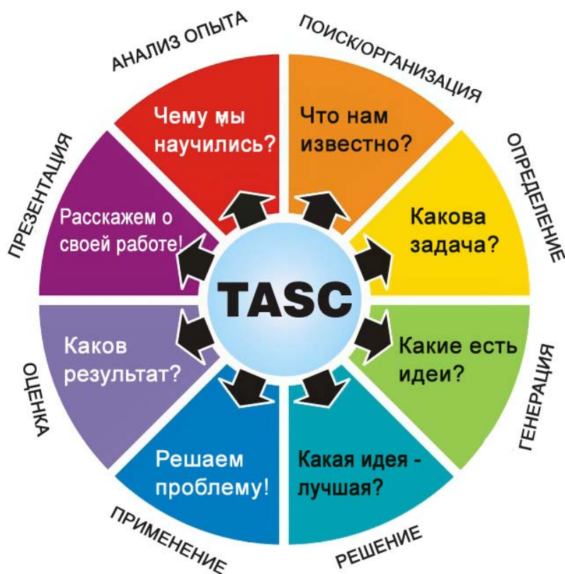
Рис.1. Интерактивный круг TASC

Мы рассмотрим основные принципы работы с кругом TASC на примере мелкогрупповой работы учащихся по подготовке творческого проекта. Работа с кругом TASC проходит 8 этапов. Учащиеся могут перемещать встроенный указатель по часовой стрелке по мере прохождения каждого этапа работы и таким образом регулировать темп работы и адекватно распределять свои силы.